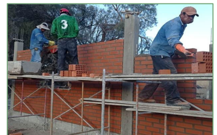
Die Maurer in Aktion

Fundamenten, mit Unterstützung der Gemeinde. Nach Abschluss der Aushubarbeiten wurden die Fundamente gegossen.