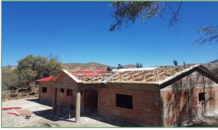
Die Dacharbeiten beginnen

Der Bau mit einer Grundfläche von 240m 2 weist nun auf: