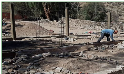
Fundamentarbeiten in Pekajsi

Die Bauarbeiten wurden in Absprache mit unserem Partner vor Ort bereits am 15. Juli 2022 begonnen.